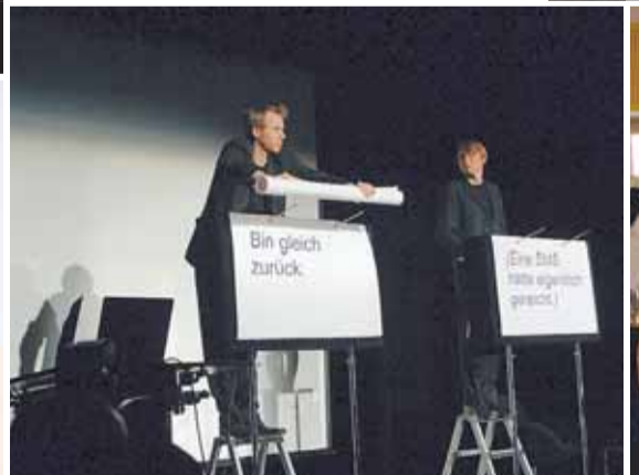
Bot beste Unterhaltung zwischen dem intellektuellen Stoff: «Ohne Rolf» begeisterten die Symposium-Teilnehmer.